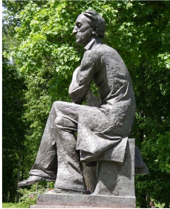
Памятник Тютчеву в музее-заповеднике «Овстуг»

Федор Тютчев умер 27 июля 1873 года в Царском селе (ныне – Пушкинский район Санкт-Петербурга) и был похоронен на Новодевичьем кладбище. В 1920 году в подмосковном Муранове открылась музей-усадьба поэта, также в 1980-х гг. было восстановлено здание родовой усадьбы Тютчевых в Овстуге.