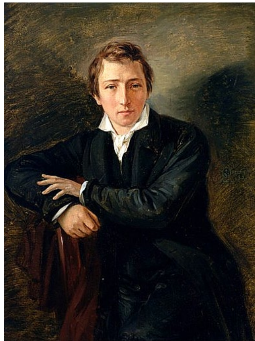
Г. Гейне, худ. М. Д. Оппенгейм, 1831 г.

Федор Иванович первым перевел на русский язык самое известное стихотворение Генриха Гейне «Сосна». В варианте Тютчева оно начинается строками «На севере мрачном, на дикой скале...». Позже его примеру последует М. Ю. Лермонтов, и получится знаменитое «На севере диком...».