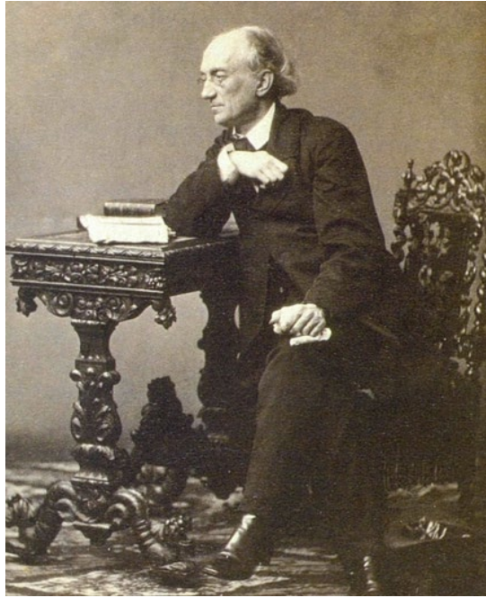
Тютчев в 1860-1861 гг.

Поэт вместе с семьей вернулся в Россию в 1844 году. На родине Тютчев присоединяется к литературному кружку В. Г. Белинского, получает чин тайного советника и звание члена-корреспондента Императорской Санкт-Петербургской академии наук.