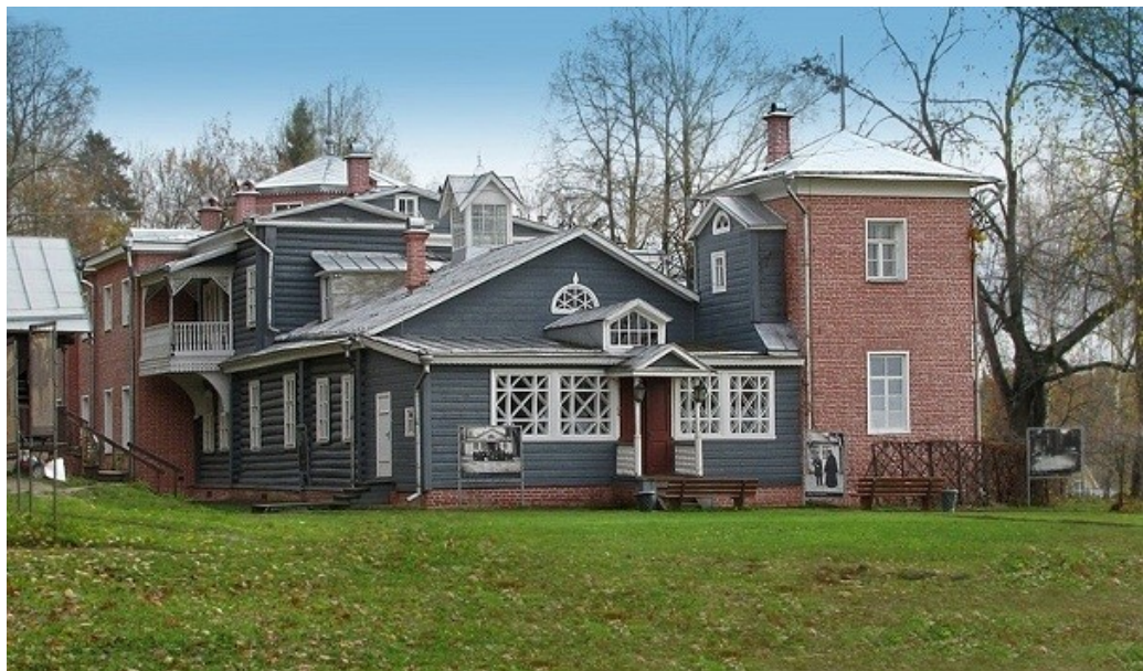
Музей-усадьба Тютчевых в Мураново

Федор Тютчев умер 27 июля 1873 года в Царском селе (ныне – Пушкинский район Санкт-Петербурга) и был похоронен на Новодевичьем кладбище. В 1920 году в подмосковном Муранове открылась музей-усадьба поэта, также в 1980-х гг. было восстановлено здание родовой усадьбы Тютчевых в Овстуге.