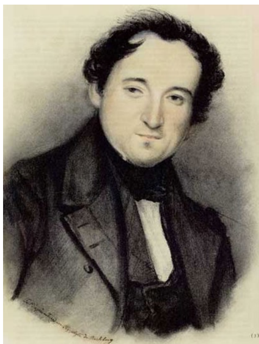
Ф. И. Тютчев, худ. И. Рехберг, 1838 г.

Свои первые литературные опыты Тютчев зачитывал в Обществе любителей российской словесности, одним из основателей которого был дядя А. С. Пушкина – В. Л. Пушкин. Уже в 1821 году Тютчев окончил словесное отделение Имперского Московского университета. Первый год по окончании университета поэт провел в Петербурге, поступив на службу в Государственную коллегію иностранных дел.