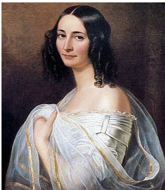
Эрнестина Тютчева, жена поэта, худ. Ф. Дюрк, 1840 г.

В 1826 году, Тютчев женится на Элеоноре Петерсон, в браке у них родились три дочери. В 1838 году пароход, на котором Элеонора путешествовала вместе с детьми, загорелся. Всем удалось спастись, но Элеонора от сильного нервного потрясения заболевает и вскоре умирает.