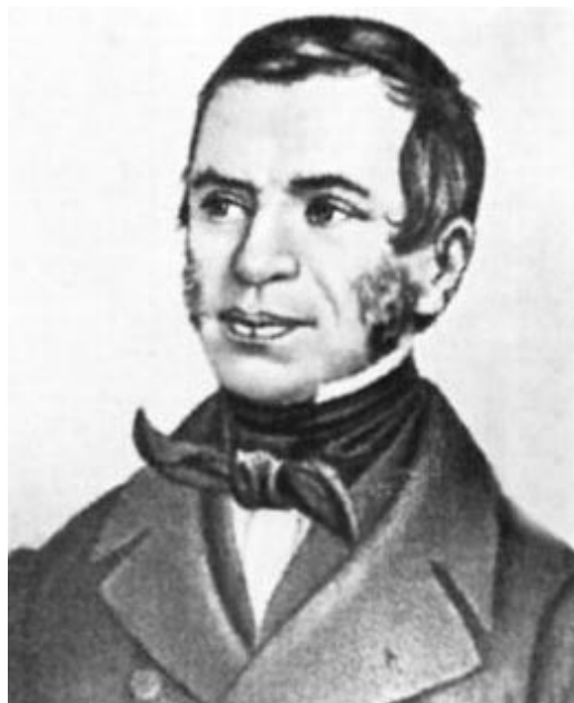
М. П. Погодин, неизв. худ., 1846 г.

Мать поэта, Екатерина Львовна Толстая, была дальней родственницей писателей Алексея Константиновича и Льва Николаевича Толстых. Она родила в браке шестерых детей, придерживалась очень консервативных взглядов, соблюдала все православные и русские дворянские обычаи.