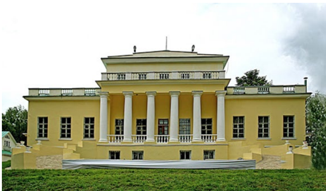
Имение Тютчевых в Овстуге

Федор Иванович Тютчев появляется на свет 23 ноября [5 декабря] 1803 года в родовой усадьбе Тютчевых в селе Овстуг Брянского уезда (сейчас – Брянская область). Первое упоминание о роде Тютчевых встречается в «Сказании о мамеевом побоище» (XVвек).