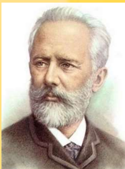
Пётр Ильич Чайковский

ВЕДУЩИЙ 2: Обаятельная, общительная, она была интересной собеседницей, привлекала своим пытливым и живым умом, располагала к себе людей, однако мечтала об остроумных собеседниках, занимательных дискуссиях, путешествиях. Каждая поездка в столицы была заполнена посещением театров и концертов, стремлением к духовным ценностям жизни.