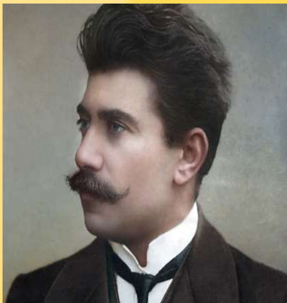
Рейнгольд Морицевич Глиэр

играл свои сочинения. Сергей Иванович записал: «Мальчик десяти лет, имеет выдающиеся способности». Он пригласил Сережу на репетицию своей симфонии со струнными, подробно объяснил как пишутся партитуры. Послушав и проэкзаменовав Серёжу по гармонии, Сергей Иванович посоветовал пригласить музыканта-профессионала для занятий в Сонцовке. Он сам подыскал такого педагога – Рейнгольда Морицевича Глиэра, молодого композитора, который только что окончил консерваторию с золотой медалью.