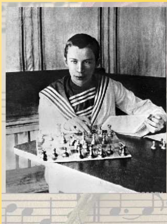
Сергей Прокофьев перед поступлением в консерваторию

ВЕДУЩИЙ 2: Окончилось детство. И уже к моменту поступления в консерваторию рыженький, розовощекий мальчик из Сонцовки – не просто музыкальный вундеркинд, а вполне сформировавшаяся личность, сильная натура, отзывчивая на всё прекрасное и ненавидевшая всё примитивное, банальное, бездарное.