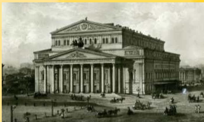
Москва, Большой театр

ВЕДУЩИЙ 2: Театр с его тайнами, выдумками вошел в жизнь мальчика, придав ей новый смысл. В качестве первого шага Сергей решает написать оперу. И вот в начале лета перед матерью лежала рукопись новой оперы «Великан», в которой уже проглядывают черты будущей индивидуальности: музыкальная лексика, стремление к впечатляющим сценическим эффектам. В опере «Великан» еще видна неопытность автора, однако ярко проявляется его талант. Он сам сочиняет и либретто. Первая опера в трех действиях (6 картинах) создана в возрасте девяти лет. Впечатления от услышанных в Москве «Фаусте» и «Князе Игоре» отразились в придуманном Прокофьевым сюжете и музыкальных набросках. К удивлению мамы, они оказались складными и даже занятными. Тут можно вспомнить Моцарта, сочинившего свое первое оперное произведение в 11-летнем возрасте.