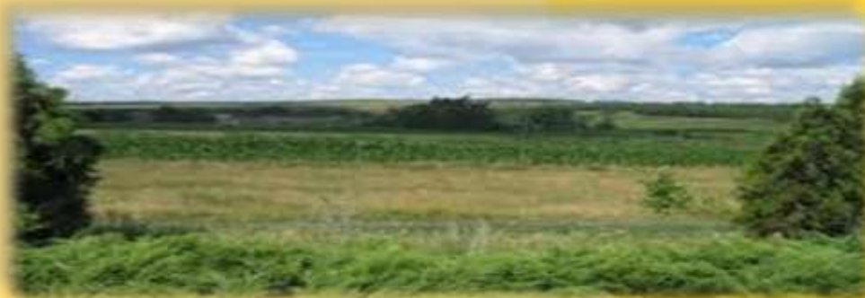
Виды села Сонцовка

ВЕДУЩИЙ 1: Сегодня мы начинаем цикл музыкальных путешествий по жизненному и творческому пути нашего земляка, композитора Сергея Сергеевича Прокофьева.