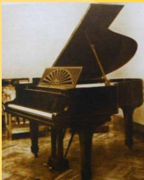
Рояль фирмы «Шрёдер». Премия по окончанию консерватории

ВЕДУЩИЙ 2: Начинается новый этап в жизни великого сына Донбасса – Сергея Сергеевича Прокофьева. Судьба композитора – это многотрудный путь неординарного творца. Его музыка проповедует великие этические идеалы, чувства сопричастности к жизни Родины, её истории и судьбе, её великой культуре.