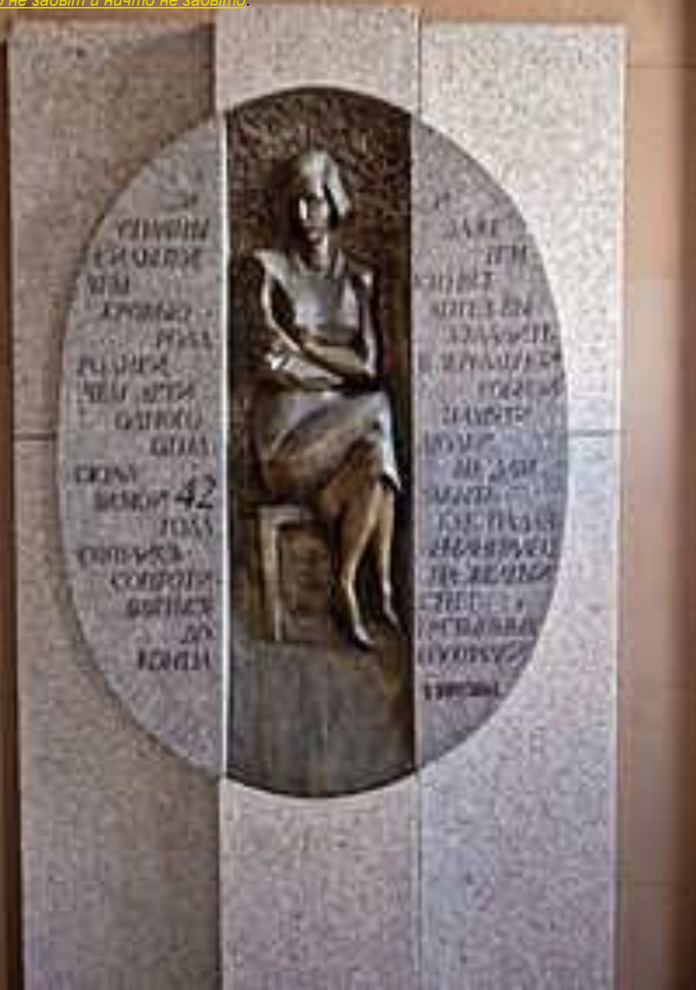
Памятная доска на Доме Радио в г. Ленинграде - Санкт- Петербурге